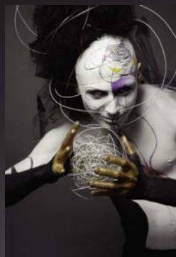
Francesca Crescini Equilibrio caotico