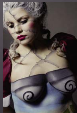
Danilza Ricatti Barocco e rococò effimera meraviglia