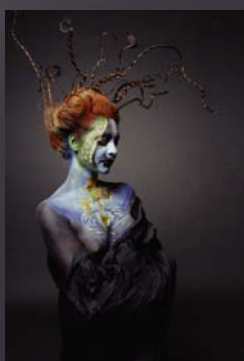
Rosanna Dell'ollo L'origine