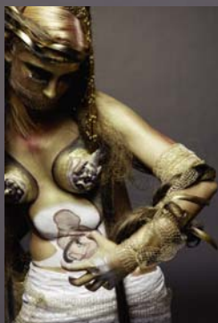
Giusy Colnaghi Inconscio